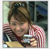
のーちゃん WEBデザイナー 最近、家の近くの天満市場で買う魚にハマっています。新鮮で美味しい!

自分の好きな色、内容でホームページを作ってしまったいませんか？ お店のお客様が好きそうな色、欲しい情報を、今一度考えてみてはいかがでしょうか！