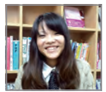
じゃすみん WEBデザイナー はやく暖かくなってほしいです…

料理の写真を撮ったけど、きれいに撮れない! ってことよくあるかと思いますが。私もよくあります。最近スマートフォンカメラアプリが充実してきて、加工することでおいしくきれいな写真にすることができます。でも、加工せずにきれいに撮るのがやっぱり良いですよ。 料理をきれいに撮るときのちょっとしたコツは、